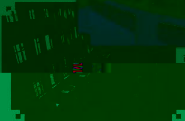
商贸管理类专业 综合训练场所